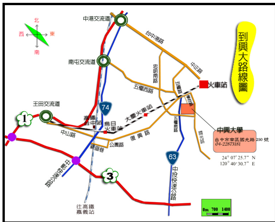
Figure 1 交通路線圖一