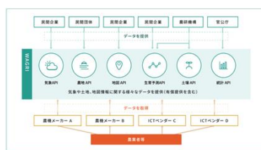
圖4、WAGRI數據資料服務架構