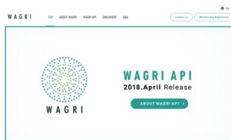
圖3、日本農業數據協作平台

日本農業資訊共享平台(WAGRI)：以全國性規模進行模組設計，以「鏈結」、「共享」、「提供」三大功能為目標，並應用這些功能，提供資訊查閱、傳送、處理與交易等服務，成為農業相關資訊與市場情報之渠道。