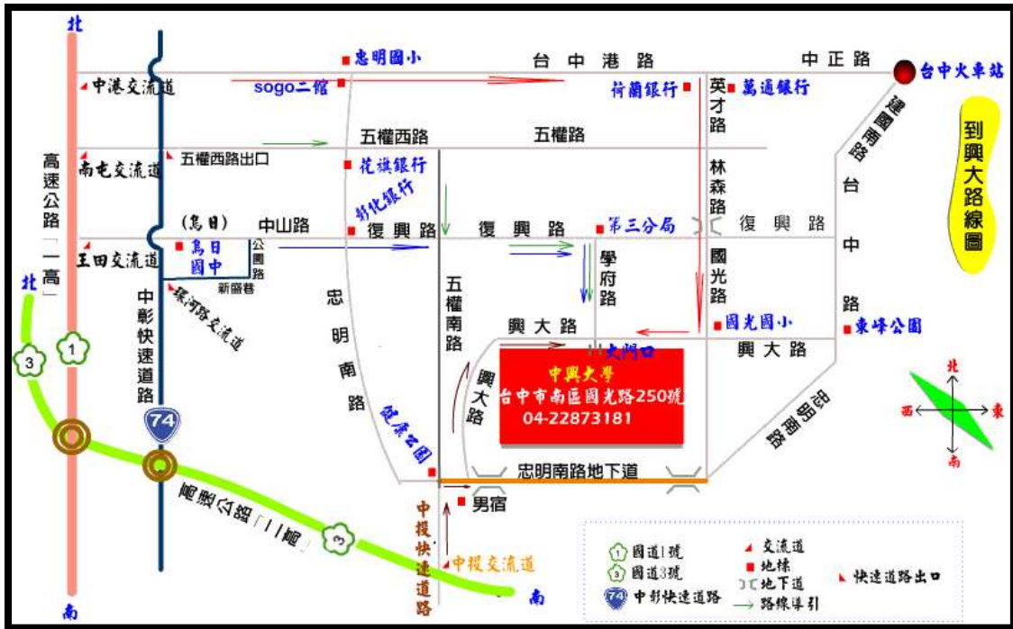
Figure 2 交通路線圖二