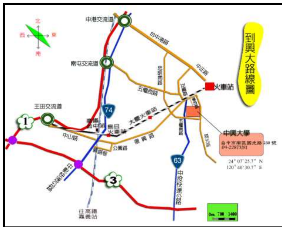
Figure 1 交通路線圖一